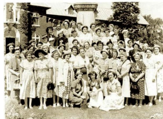
Cercle des Fermières de Sainte-Philomène Chapelle de la Réparation 1952

Année après année, des actions communautaires seront posées et parfois développées au sein du Cercle, avant de devenir autonomes, certaines demeurant encore actives aujourd'hui.