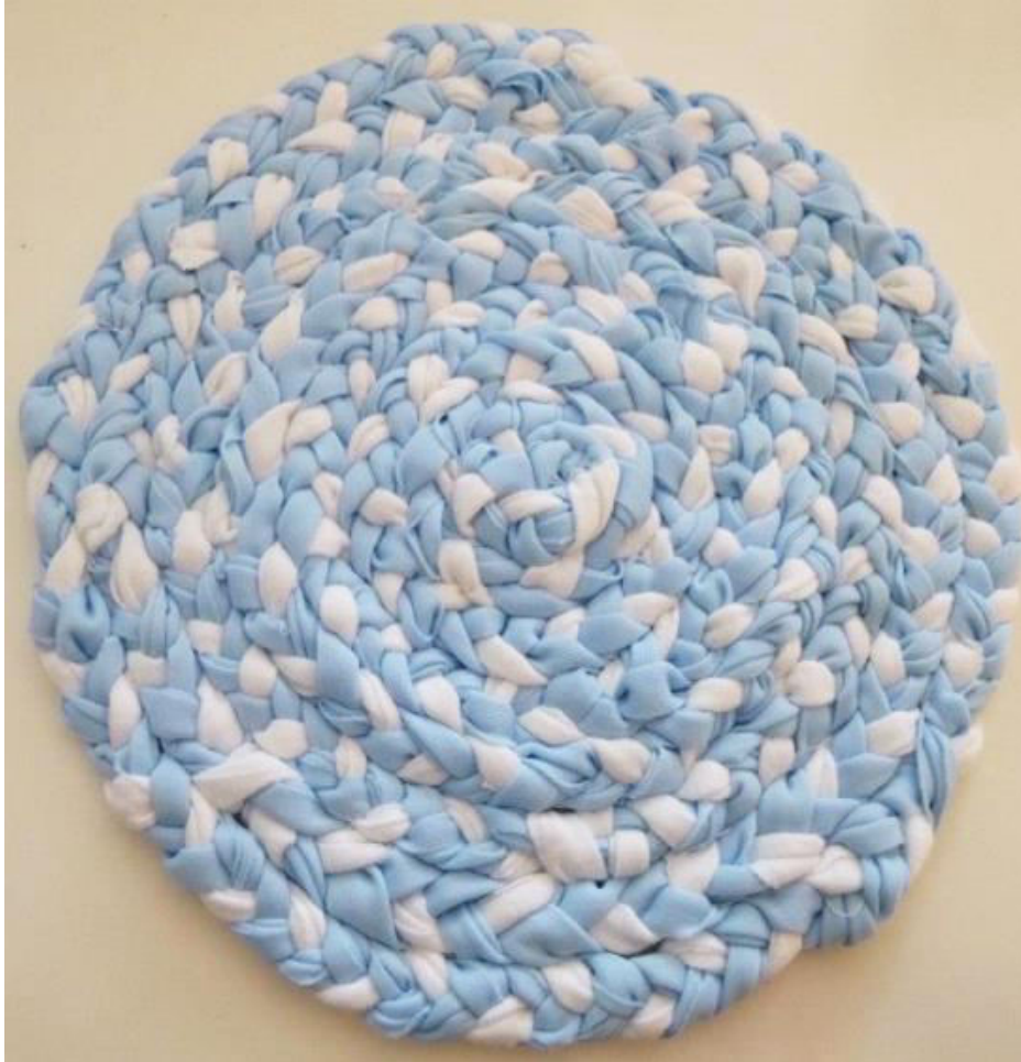
Anne-Sophie Day, gagnante du tirage

* Volet "Artisanat jeunesse" sous-plat tressé