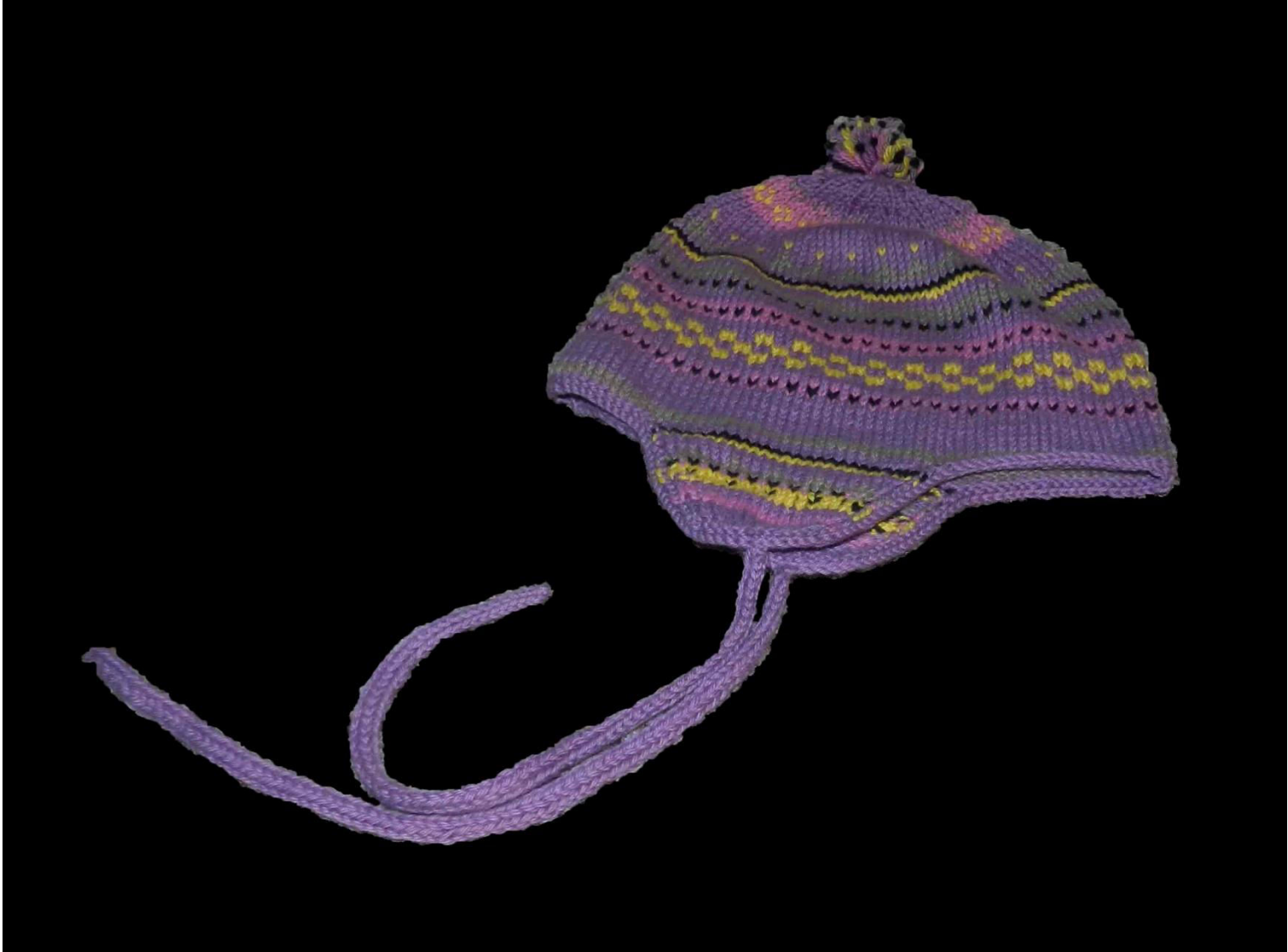
Lyne Valerand, 3ème prix