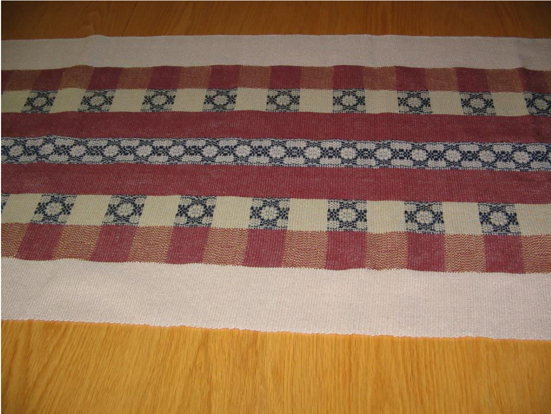
Rollande O'Brien, 3ème prix